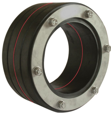
V2A Druckplatte mit 2 x 40 mm Gummi aus EPDM