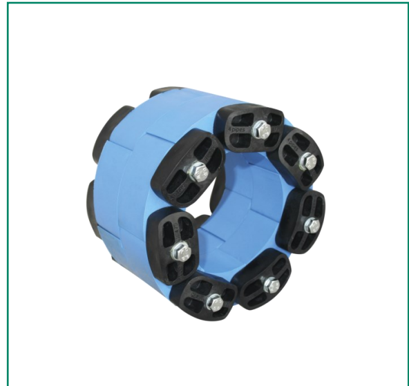
Pressio-Elements 4 pipes - Abmessungen in mm